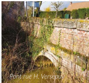
Pont rue H. Versepuy

Les franchissements situés sur le ru de Fréniches à Guiscard