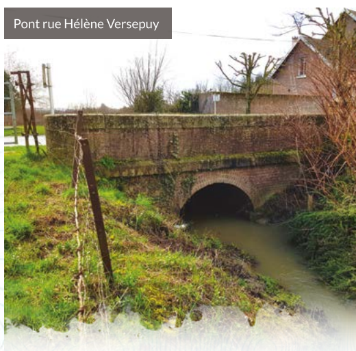
Pont rue Hélène Versepuy

Les travaux seront réalisés après la construction des barrages de Berlancourt et Beaugies-sous-Bois. L'opération (études et travaux) est estimée à un coût de 175 000 euros HT et est financée à 100% par l'Entente Oise-Aisne. ■