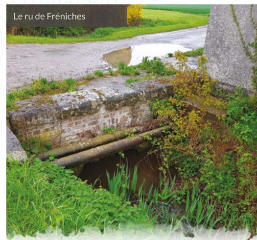
Le ru de Fréniches

Les ponts cadres qui seront posés à la place seront d'une dimension prévisionnelle de 2,5 mètres par 1,5 mètre. Les études devraient durer un an et le chantier deux mois environ. Le coût prévisionnel de l'opération (études et travaux) est estimé à 290 000 euros HT. Les travaux sont financés à 65% par l'Entente Oise-Aisne, 15% par le Conseil Départemental de l'Oise et 20% par le syndicat de la Verse. ■